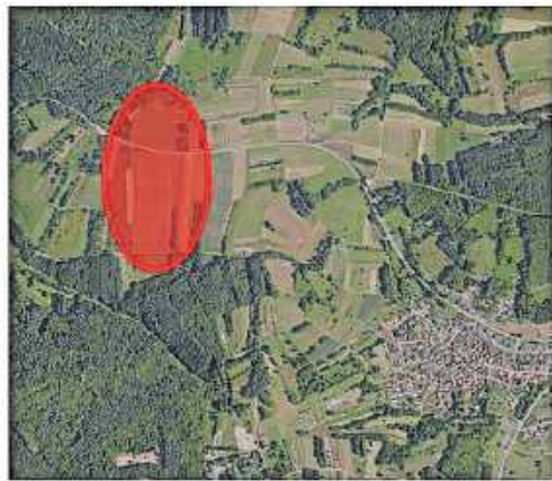
Abbildung 1: Lage im Raum, Detailkarte Deutschland (Dachstuhl)