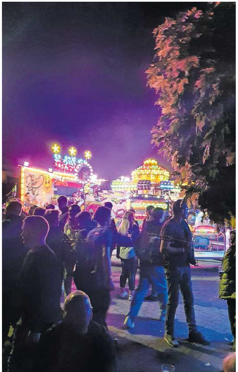
Kerweatmosphäre in Wernersberg