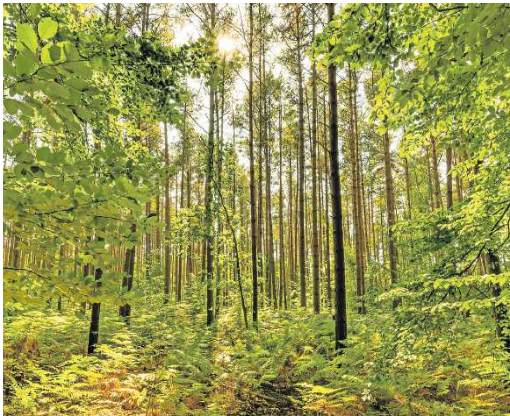
Förderprogramm: Klimagerechter Umbau des Waldes kommt voran/Symbolbild

Dazu sagt Bundesminister Cem Özdemir: „Unser Förderprogramm für einen starken Wald in Deutschland wird sehr gut angenommen. Die volle Ausschöpfung der Mittel zeigt, dass Waldbesitzer den Kampf gegen die Klimakrise engagiert aufnehmen, und dabei unterstützen wir sie nach Kräften. Ich freue mich sehr, dass so viel Wald in ganz Deutschland die nächsten Jahre noch stärker nach klimastabilen Kriterien bewirtschaftet wird. Die