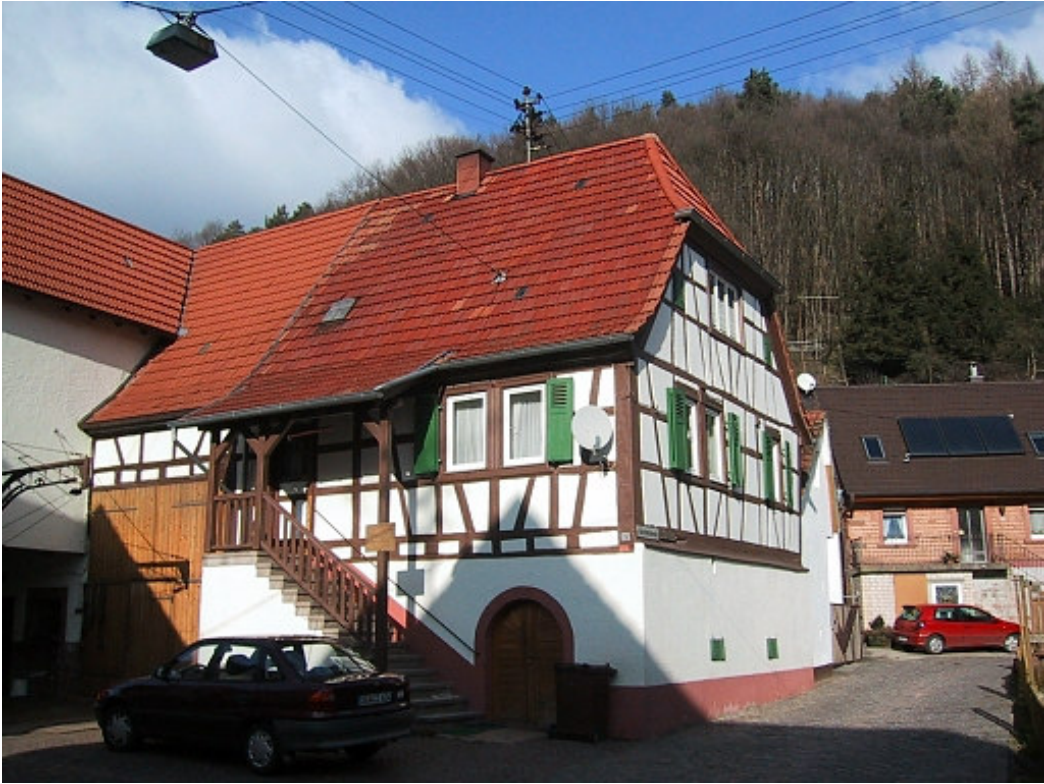
Bild 4: Bei Fachwerkgebäuden sind Fensteröffnungen auf die ursprünglichen Pfostenabstände abgestimmt.