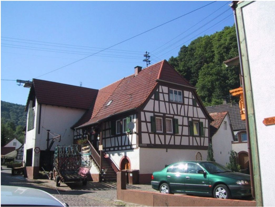
Bild 7: ...Gestaltung von Hof-, Lager-, Abstellflächen im Einklang mit dem historischen Straßen- und Ortsbild