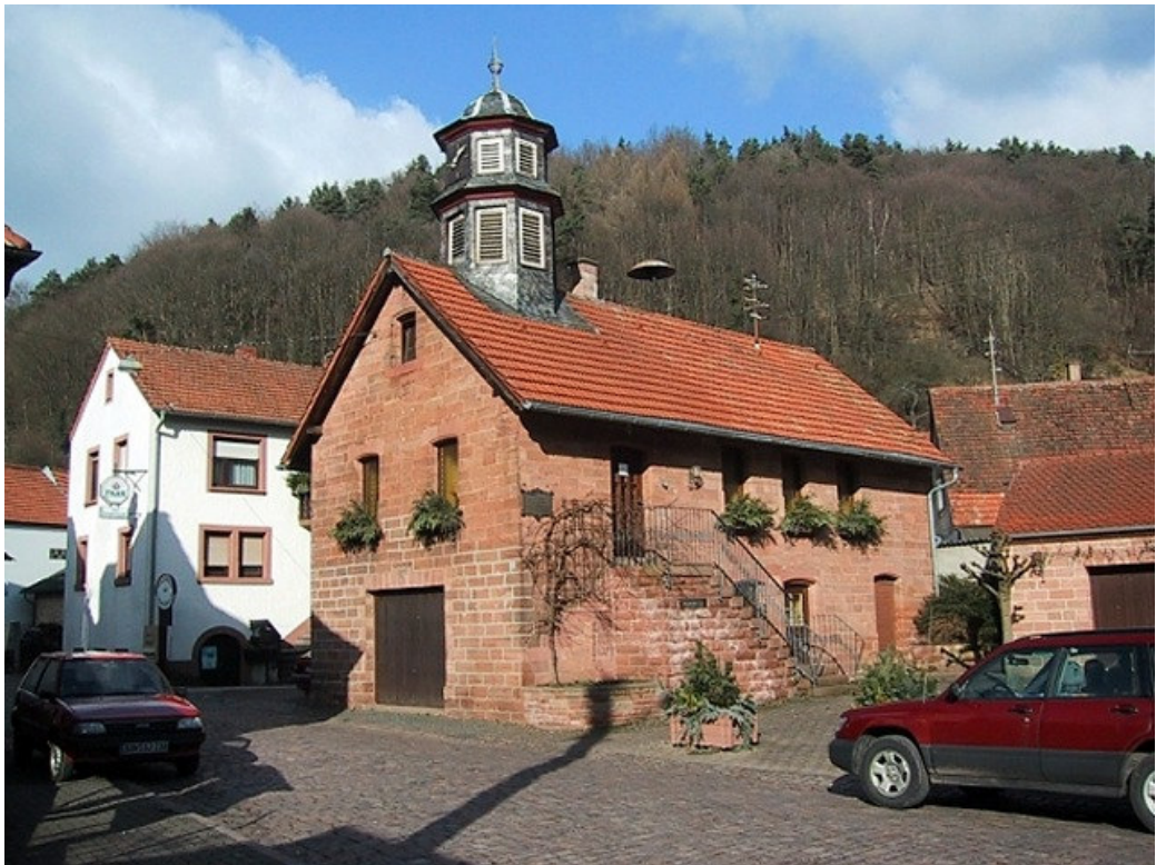
Bild 2: Zulässig sind naturrote bis rotbraune Dacheindeckungen, an historischen Gebäuden ist auch Schiefer zur Dacheindeckung zulässig.