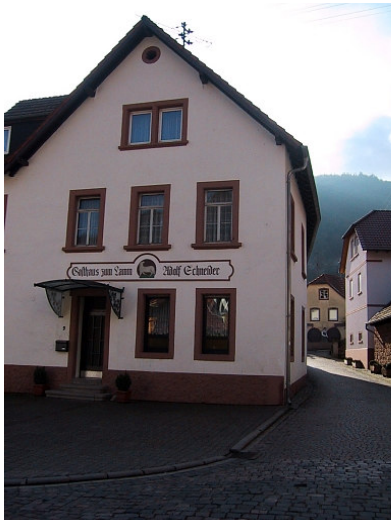
Bild 3: Weitgehende symmetrische Aufteilung der Fassade. Fenster weisen aufrechte rechteckige Formate auf und sind vorzugsweise durch Sprossen gegliedert. Werbung in Form von aufgemalten Schriften, Vordächer ordnen sich der Fassadengliederung unter.