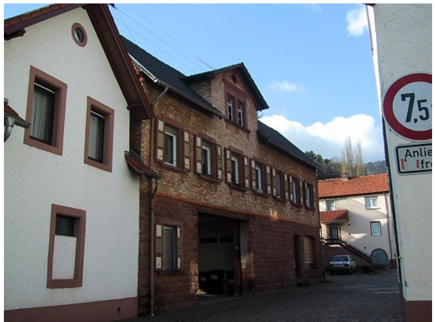
Bild 6: Material und Farbgebung... Typische Fassadenmaterialien sind Verputz, regelmäßiges Sandsteinmauerwerk oder Sichtmauerwerk aus Tonziegeln.