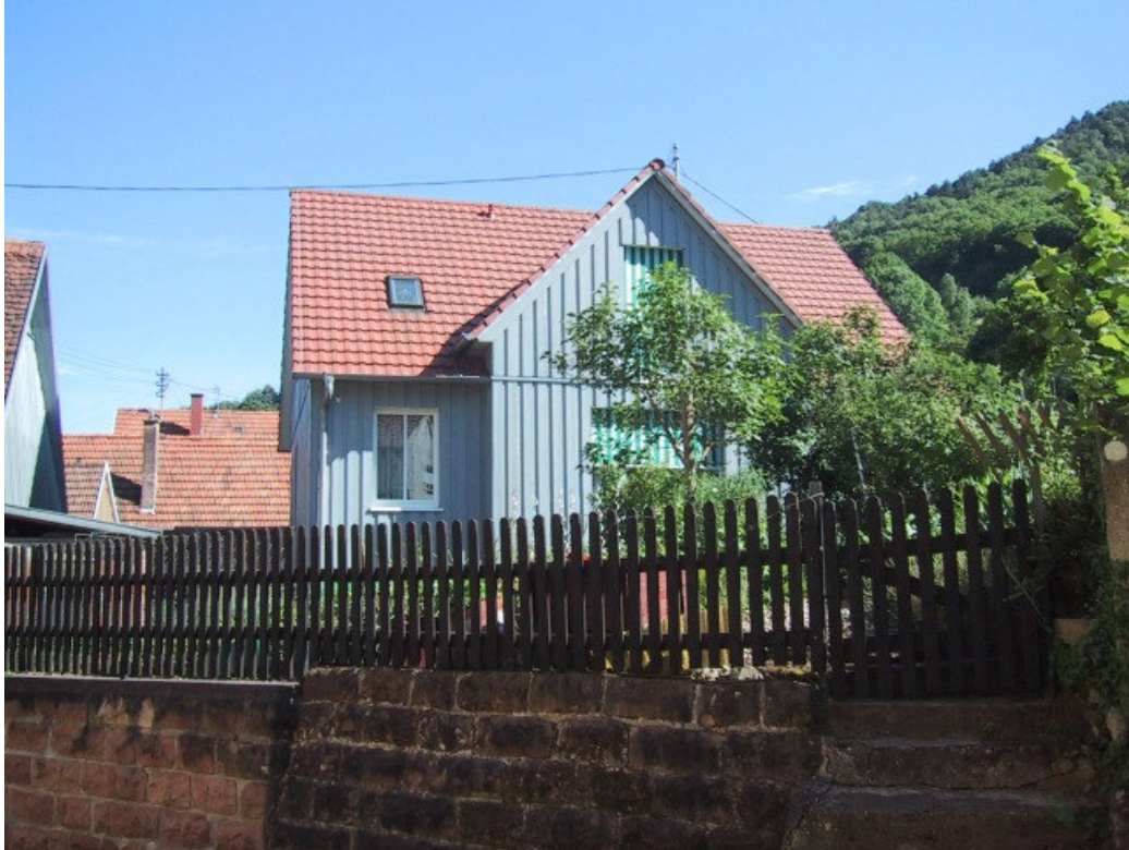
Bild 1: Einfügung von Neubauten hinsichtlich Gebäude- und Dachform, Proportionen, Fassadengliederung, Material...