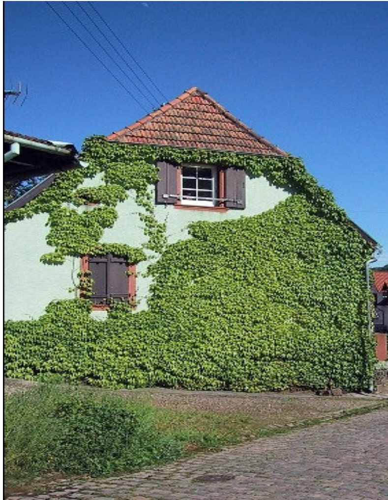
Bild 8: ...nicht überbaute Flächen bebauter Grundstücke nur im unbedingt erforderlichen Umfang versiegeln.