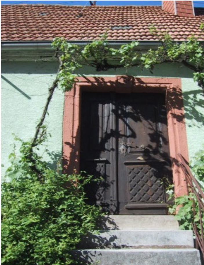
Bild 5: ... originale historische Türen und Tore sind soweit wie möglich zu erhalten.